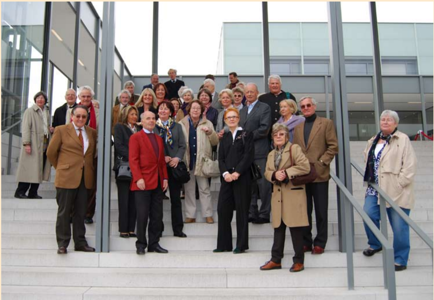
Der Uniclub bei seinem Besuch der Jubiläumsausstellung „Das schönste Museum der Welt“ im Folkwang Museum in Essen, das von David Chipperfield stilsicher erweitert wurde.